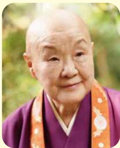
瀬戸内 寂聴 作家