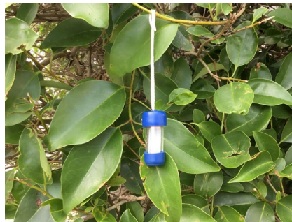
二酸化ちっ素捕集管