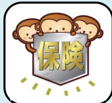
スッキリわかる 保険(生命保険・医療保険)