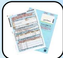
ねんきん定期便の読み方