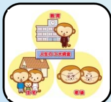
ママのスキルアップ講座 (教育・住宅・老後)