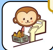
主婦のための働き方レッスン (103万円・130万円の壁)