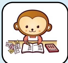
家計の見直し・節約