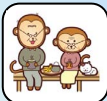
夫婦で考えるセカンドライフ エンディングノートを 作ってみませんか？