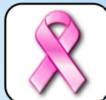
乳がん触診モデルを使った学習会