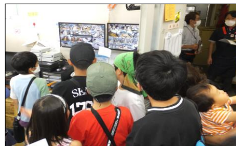
花畑店バックヤードツアー&買い物体験学習会