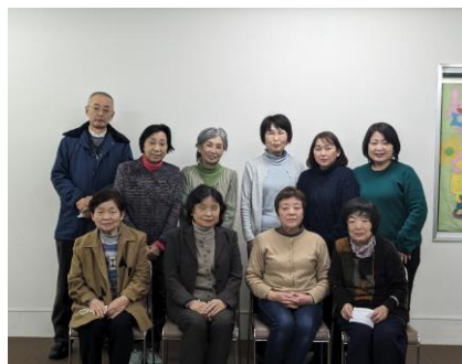
エフコープ城南区域委員会